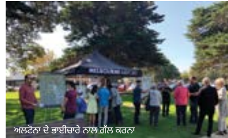
ਅਲਟੋਨਾ ਦੇ ਭਾਈਚਾਰੇ ਨਾਲ ਗੱਲ ਕਰਨਾ

ਦੇ ਖਰੜਿਆਂ ਵਿੱਚ ਤਬਦੀਲੀਆਂ ਕਰ ਰਹੀ ਹੈ। ਸਲਾਹ-ਮਸ਼ਵਰੇ ਦੇ 104 ਦਿਨਾਂ ਦੌਰਾਨ, ਟੀਮ ਨੇ ਭਾਈਚਾਰਿਆਂ ਵਿੱਚ 50 ਤੋਂ ਵਧੇਰੇ ਆਹਮਣੇ-ਸਾਹਮਣੇ ਦੇ ਜਾਣਕਾਰੀ ਸੈਸ਼ਨਾਂ ਦੀ ਮੇਜ਼ਬਾਨੀ ਕੀਤੀ ਜਿੰਨ੍ਹਾਂ ਵਿੱਚ ਸ਼ਾਮਲ ਸਨ ਕੀਲਰ, ਸਨਬਰੀ, ਫੁੱਟਸਕਰੇਅ, ਅਲਟੋਨਾ, ਬੁੱਲਾ, ਟੇਲਰਜ਼ ਲੇਕਸ ਅਤੇ ਸਨਸ਼ਾਈਨ, ਅਤੇ ਨਾਲ ਹੀ ਨਾਲ ਕਈ ਸਾਰੇ ਔਨਲਾਈਨ ਸੈਸ਼ਨ।