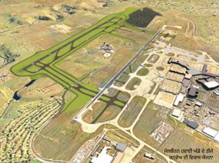
ਮੈਲਬੌਰਨ ਹਵਾਈ ਅੱਡੇ ਦੇ ਤੀਜੇ ਰਨਵੇਅ ਦੀ ਵਿਕਾਸ ਯੋਜਨਾ

ਸਾਡੇ ਔਪਰੇਸ਼ਨਾਂ ਅਤੇ ਪ੍ਰੋਜੈਕਟਾਂ, ਰਨਵੇਅ ਯੋਜਨਾਵਾਂ ਅਤੇ ਹੋਰ ਸਬੰਧਿਤ ਖ਼ਬਰਾਂ ਬਾਰੇ ਤੁਹਾਨੂੰ ਸੂਚਿਤ ਕਰੀ ਰੱਖਣ ਲਈ ਮੈਲਬੌਰਨ ਹਵਾਈ ਅੱਡੇ ਦੇ ਭਾਈਚਾਰਕ ਖਬਰਨਾਮੇ (ਨਿਊਜ਼ਲੈਟਰ) ਦੇ ਪਹਿਲੇ ਸੰਸਕਰਣ ਵਿੱਚ ਤੁਹਾਡਾ ਸਵਾਗਤ ਹੈ।