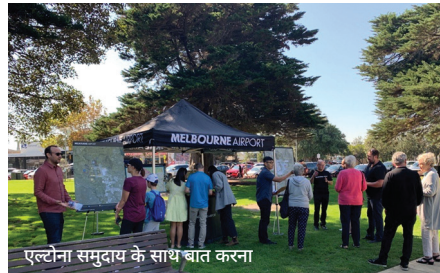
एल्टोना समुदाय के साथ बात करना

परामर्श के 104 दिनों के दौरान, टीम ने 50 से भी अधिक आमने-सामने के सूचना सत्रों की समुदायों में मेजबानी की, जिनमें कीलोर, सनबरी, फुटस्के, एल्टोना, बुल्ला, टेलर्स लेक्स और सनशाइन समुदायों के साथ-साथ कई ऑनलाइन सत्र भी शामिल थे।