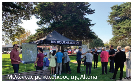
Μιλώντας με κατοίκους της Altona

Κατά τη διάρκεια των 104 ημερών διαβούλευσης, η ομάδα διεξήγαγε περισσότερες από 50 ζωντανές ενημερωτικές συνεδρίες σε προάστια όπως Keilor, Sunbury, Footscray, Altona, Bulla, Taylors Lakes και Sunshine, καθώς και πολλές διαδικτυακές ημερίδες.